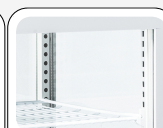
Lampe LED interne verticale