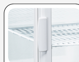
Poignée de porte